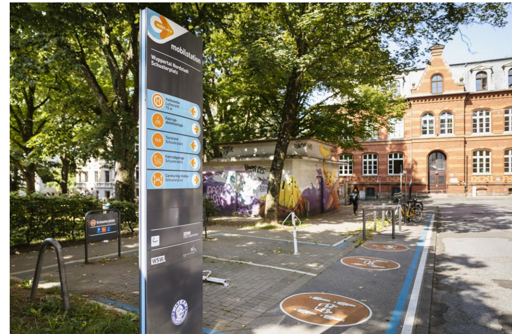
Quartiersmobilstation; Bsp.: Wuppertal Nordstadt Schusterplatz