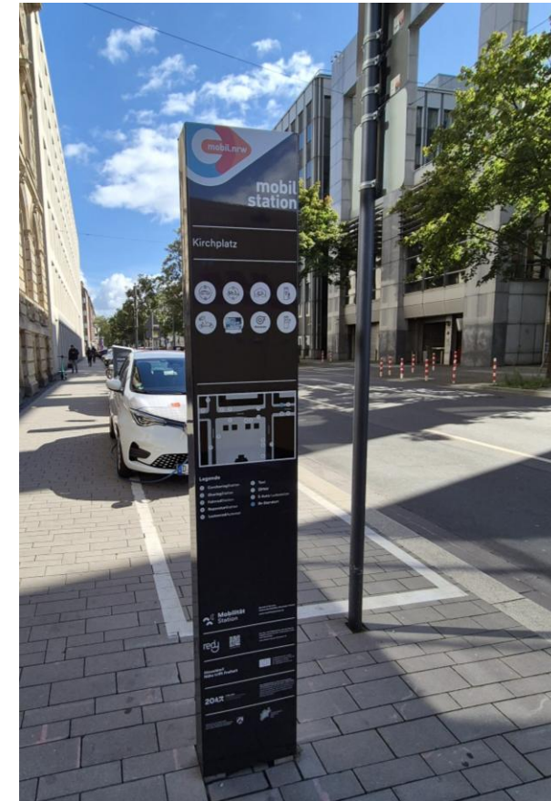
Landesdesign mobil.nrw Bsp. Mobilstationsstele Düsseldorf Kirchplatz