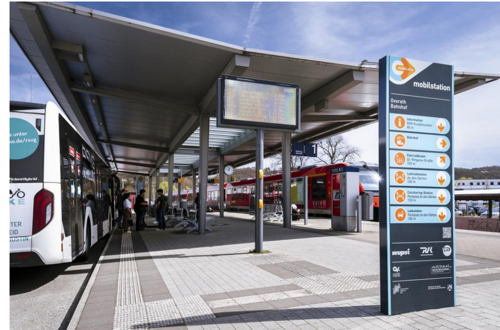
Mobilstation mit ÖPNV-Anschluss; Bsp.: Overath Bf.