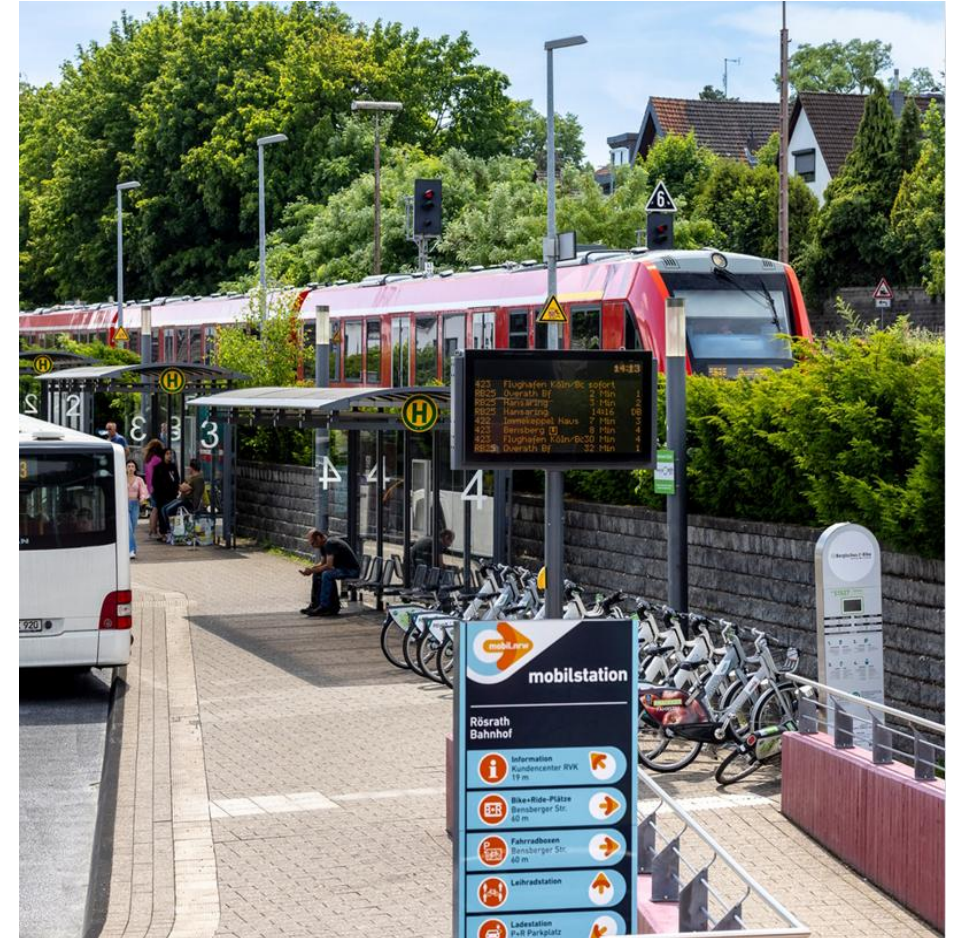
Mobilstation Rösraht Bahnhof