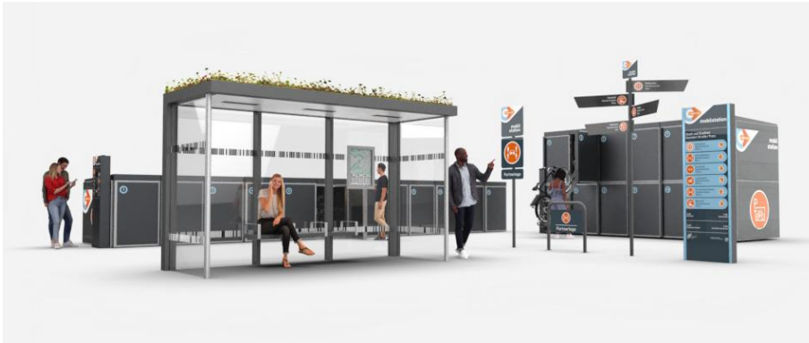
Rahmenverträge für Mobilstationselemente

Alle Informationen rund um Mobilstationen auf: Mobilstationen - wir.go.Rheinland