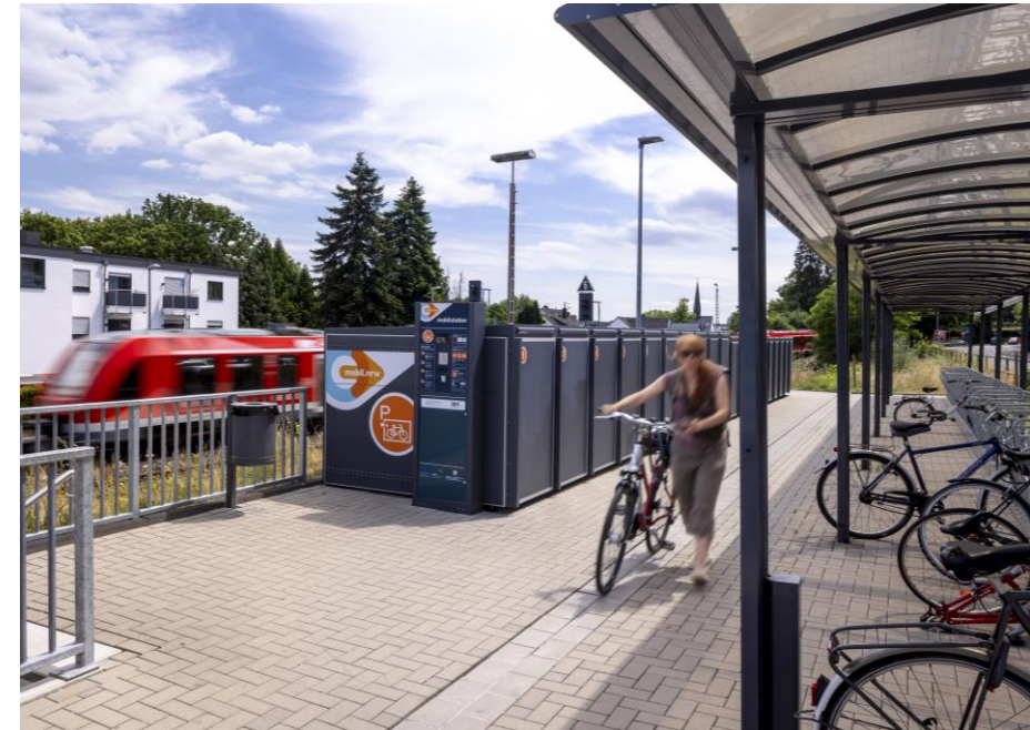
Mobilstation mit Radbox; Bsp.: Bf. Rösrath