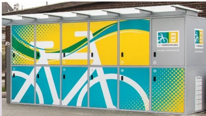
B+R-Buchungs- und Zugangssystem DeinRadschloss DeinRadschloss: DeinRadschloss