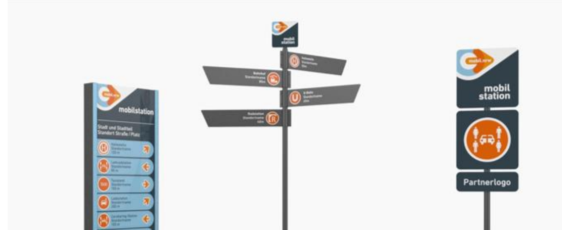
Beschilderung und Informationsstele