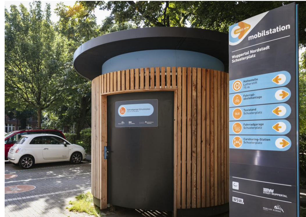
Quartiersmobilstation mit Fahrradgarage; Bsp.: Wuppertal Nordstadt Schusterplatz