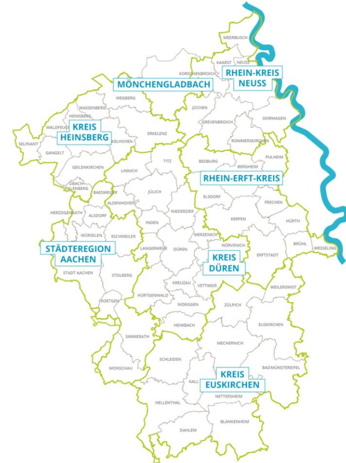
Fördergebiet (Rheinisches Revier)