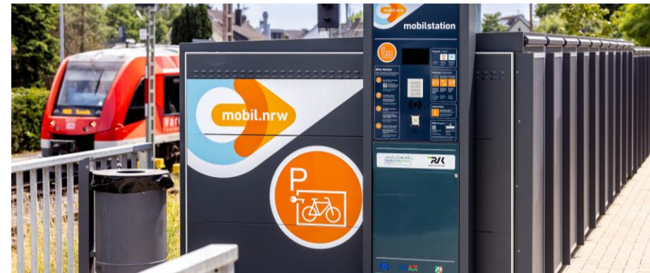
B+R-Buchungs- und Zugangssystem radbox.nrw