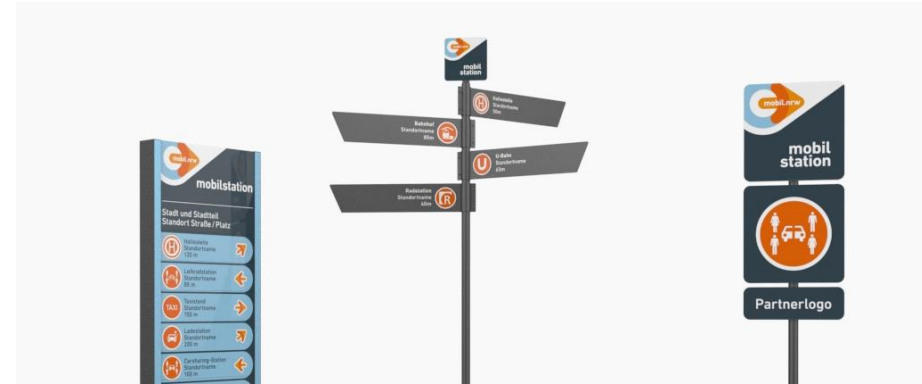
Landesdesign mobil.nrw & Online-Gestaltungstool