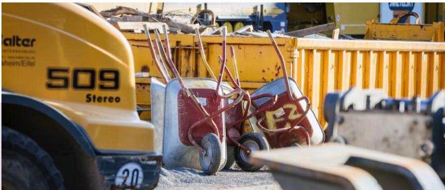
Musterausschreibungsunterlagen für Mobilstationsplanungen